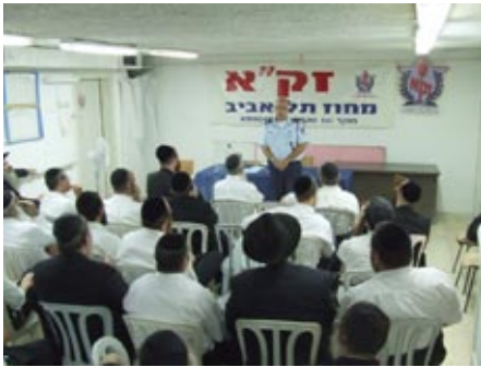
מתנדבי זק"א בסדרת הדרכות מקצועיות

מאת גדולי ישראל ובראשם מרן הגאון הגדול רבי יוסף שלום אלישיב שליט"א. בקשב רב נשמעה עדותו על כל מהלך איסוף וזיהוי הגופות באסון שארע לפני מס' שנים בציר פילדלפי, כאשר תוך סיכון רב סיננו את החול ואספו פיסות פיסות של חלקי גוף ורקמות, ועל פי פסק ההלכה נמשכה העבודה גם לתוך שבת קודש, תוך כדי סיכון נפשות ממש, למול הצלפים הפלסטינים בחאן יונס. קטע נרחב נתן בהרצאתו המאלפת לחשיבות