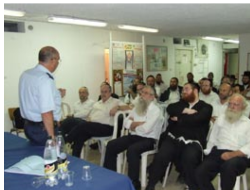
מתנדבי זק"א בסדרת הדרכות מקצועיות

האחדות ודיבוק החברים במשימות קשות אלו, וסיפור שעמידתם בכל המראות והקשיים הפיזיים היה בכח אחדותם וריקודים בהודיה להש"ת אל תוך הלילה, לאחר כל משימה שהושלמה עד למקסימום יכולתם.